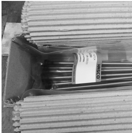
Einzelteile im Karton, Plastiktüte und Wellpappe zum Schutz