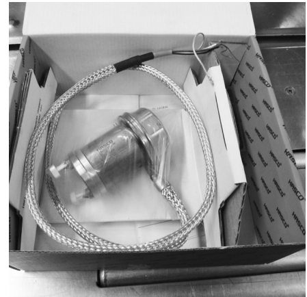
Nutzung der HASCO-Originalverpackung