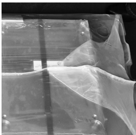
Plaques sur une palette avec support carton, colliers tendeurs et film plastique