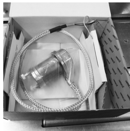
Utilisation de l'emballage HASCO d'origine